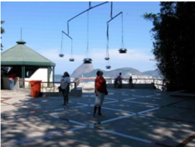
O MobilaSom, Museo do Parque das ruínas Rio de Janeiro, 2008.

O público como numa web-radio pode ouvir o MobilaSom no internet, ele também pode participar depositando suas próprias musicas, entrevistas e paisagens sonoras; conectando-se no sitio o ligando na caixa de mensagem do MobilaSom.