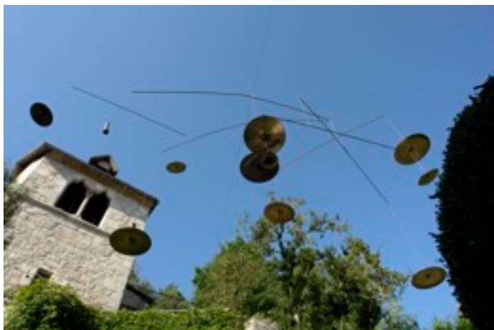
O Calderofone jardim da «casa Daura», St Cirq Lapopie, 2007.

Para entrar neste “universo”, cada visitante é convidado a soltar sua imaginação e tocar os pratos, com baquetas de bambu. Cada ação do espectador-músico, cada choque, cada tilintar provoca um movimento de todo o móbile. A obra faz alusão à alegria dos móveis de Calder, e reinventa uma nova cosmologia sonora e visual. Ele é uma representação da galáxia: 9 pratos como os 9 planetas do nosso sistema solar. Batutas gigantes são colocadas à disposição dos espectadores para que eles possam se tornar percussionistas, escultores de som e do espaço.